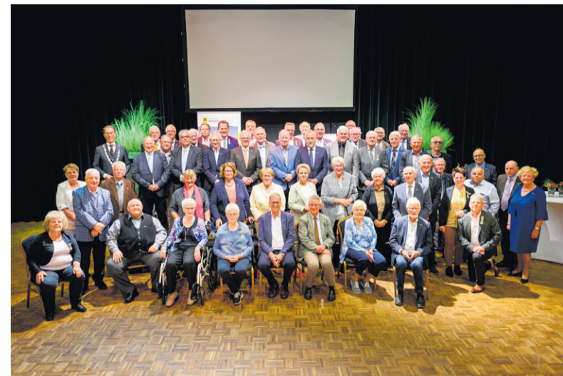
Feestelijke bijeenkomst gedecoreerden 2022