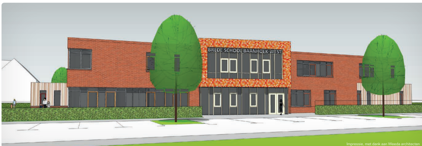
Impressie, met dank aan Weeda architecten

Volgend schooljaar gaan de kinderen in Baanhoek-West naar school in een gloednieuw pand. Het wordt gebouwd op het terrein waar nu een tijdelijk schoolgebouw staat tussen de Vivaldilaan en de Menuet. Het wordt een gebouw dat past in de wijk en veel meer is dan een school. Want naast klaslokalen komt er een kinderdagverblijf én multifunctionele ruimten die ook voor sportieve en maatschappelijke activiteiten kunnen worden gebruikt. Anders gezegd, het wordt een zogenaamde 'brede school' en dat is goed nieuws voor de bewoners.